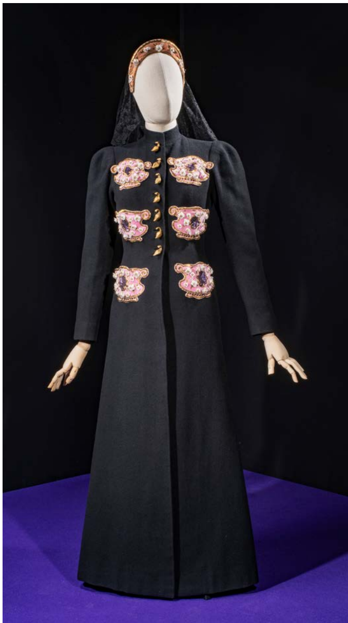
SCHIAPARELLI Collection Haute Couture Hiver 1938-1939 Broderie : Maison Lesage Collection Zodiaque Adjugé le 11 février 2021 : 542 200 € Record mondial pour une pièce Haute Couture

Toujours leader en France dans cette spécialité, avec plus de 2,4 M€, notre département Haute Couture confirme la montée en puissance de ce domaine de collection. En point d'orgue la collection de la Maison Mode Méditerranée, et le merveilleux manteau du soir réalisé par Schiaparelli, qui, après une âpre bataille d'enchères opposant plusieurs grands musées internationaux, a été adjugé 542 000 €, établissant un nouveau record mondial pour une pièce de Haute Couture.