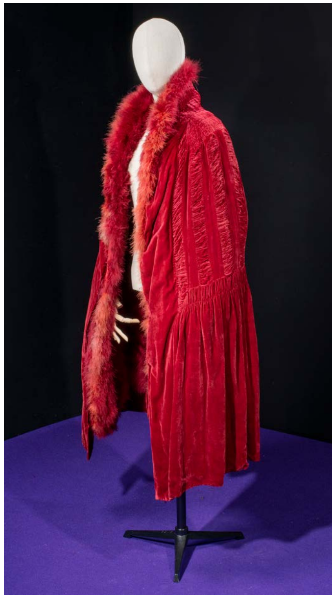
GABRIELLE CHANEL Collection Haute Couture, circa 1922 Cape du soir Adjugé le 11 février 2021 : 79 300 €